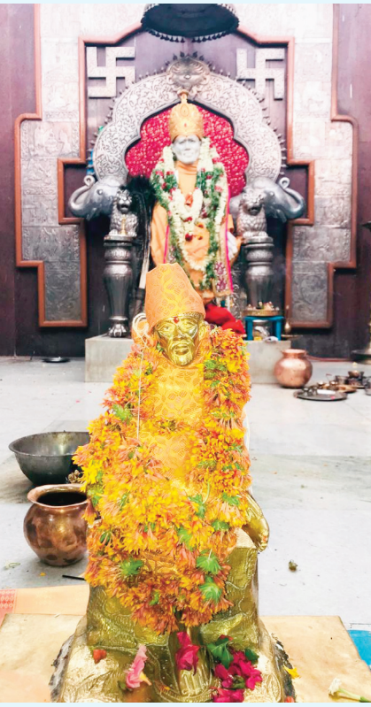
బుద్ధ పౌర్ణమి వేడుకలు

తెలంగాణ ప్రభ (కోరుట్ల) : జగిత్యాల జిల్లా కోరుట్ల పట్టణంలోని సాయిరామ దేవాలయంలో గురువారం వైశాఖ పౌర్ణమి (బుద్ధ పౌర్ణమి) సందర్భంగా కాకడ హారతి, స్వామివారికి ప్రత్యేక పూజలు నిర్వహించారు. భజనల అనంతరం తీర్థప్రసాద వితరణ, అన్నదానం చేశారు. కార్యక్రమంలో చుట్టుపక్కల గ్రామాలు, పలు జిల్లాల నుంచి భక్తులు అధిక సంఖ్యలో తరలివచ్చారు.