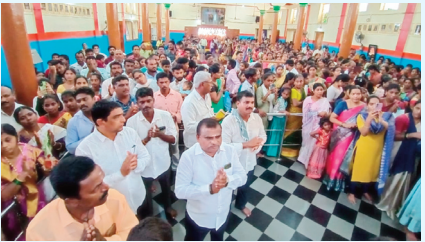
బుద్ధుడి జయంతి ఉత్సవాలు

తెలంగాణ ప్రభ (కోరుట్ల) : జగిత్యాల జిల్లా కోరుట్ల పట్టణంలోని సాయిరామ దేవాలయంలో గురువారం వైశాఖ పౌర్ణమి (బుద్ధ పౌర్ణమి) సందర్భంగా కాకడ హారతి, స్వామివారికి ప్రత్యేక పూజలు నిర్వహించారు. భజనల అనంతరం తీర్థప్రసాద వితరణ, అన్నదానం చేశారు. కార్యక్రమంలో చుట్టుపక్కల గ్రామాలు, పలు జిల్లాల నుంచి భక్తులు అధిక సంఖ్యలో తరలివచ్చారు.