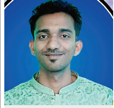
చిట్టాపూర్ మాజీ సర్పంచ్ కుమారుడు మృతి

ఢిల్లీ : లోక్సభ ఎన్నికలు-2024 నేపథ్యంలో ఆదాయపు పన్ను శాఖ రికార్డు స్థాయిలో ఏకంగా రూ.1100 కోట్ల విలువైన నగదు, ఆభరణాలను స్వాధీనం చేసుకుంది. 2019 లోక్సభ ఎన్నికల సమయంలో సీజ్ చేసిన రూ. 390 కోట్లతో పోలిస్తే ఇది 182 శాతం అధికమని ఆదాయ పన్ను శాఖ వరాలు వెల్లడించాయి. మే 30 నాటికి దేశవ్యాప్తంగా స్వాధీనం చేసుకున్న మొత్తం నగదు, ఆభరణాల విలువ సుమారు రూ.1100 కోట్లు ఉండొచ్చని తెలుస్తోంది. ఢిల్లీ, కర్ణాటకలో అత్యధిక