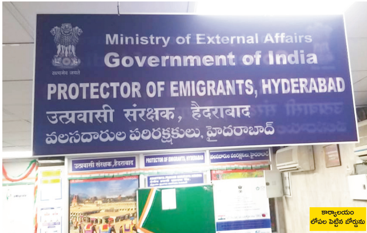
కార్యాలయ లోపల పెట్టిన బోర్డును