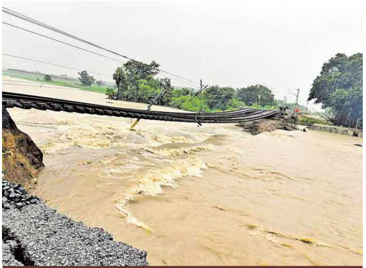
మహబూబాబాద్ జిల్లాలో ఇంటికన్నె-కేసముద్రం స్టేషన్ల మధ్య వరద ఉద్ధృతికి మట్టికొట్టుకుపోయి.. వేలాడుతున్న రైలు పట్టాలు

లంటూ మంత్రులు, ఎంపీలు, ఎమ్మెల్యేలు, ఎమ్మెల్సీలు తదితర ప్రజాప్రతినిధులకు సీఎం ఆదేశాలు జారీ చేశారు. వరదలతో ఇబ్బంది పడుతున్న వారిని ఆదుకోవాలంటూ కాంగ్రెస్ కార్యకర్తలకు రేవంత్ రెడ్డి ప్రత్యేకంగా విజ్ఞప్తి చేశారు.